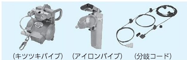
(キッツキバイブ) (アイロンバイブ) (分岐コード)